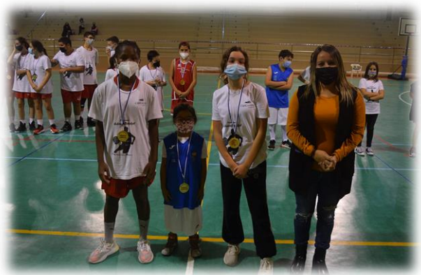
Los Ángeles de Educabasket