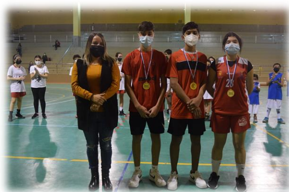
Los Papis Noel