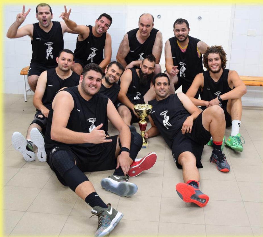
Tras el pitido final, el equipo lo celebró por todo lo alto, en la cancha, con sus aficionados, en el vestuario y en el Sisigan.