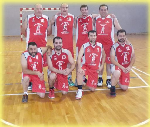
CB Sauces 2007 (Izquierda)