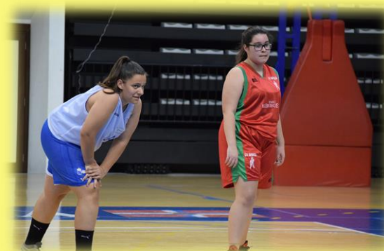
Claudia también dice adiós al equipo, tras tres años.