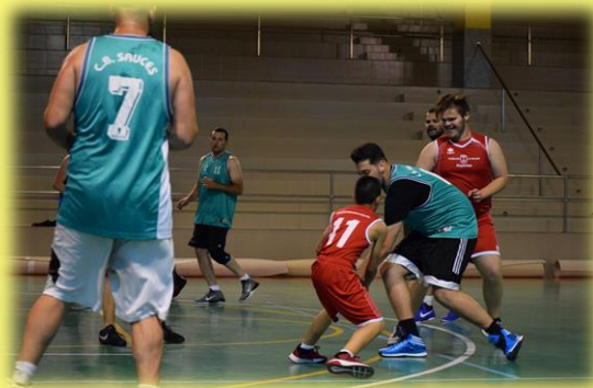
Los padres y entrenadores se esforzaron para lograr la victoria.

El pasado 19 de mayo se celebró una nueva edición del All Stars Family 2016, disputado el 24 de junio en el Pabellón Municipal. Nuestros canteranos no pudieron con ellos (44-50), por mucho que lo intentaron en otra nueva actividad de Educabasket 7. Lo de menos era el resultado, si bien los cadetes lo intentaron todo para darle la vuelta al partido. Lo importante fue la tarde-noche en familia que pasaron todos, entrenadores, jugadores y padres.