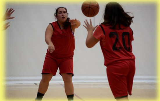
Marta fue una de las destacadas en el final de temporada.