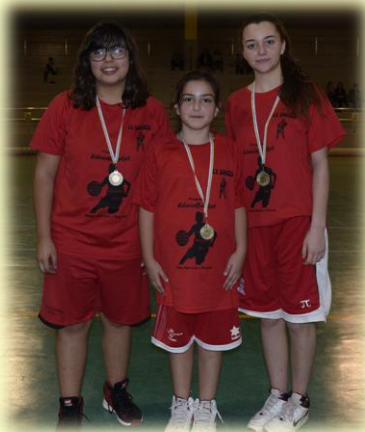
"Las Divinas", campeonas femeninas. Abajo "La Cadena" campeón mini y "Ellaspunto" campeón mixto.