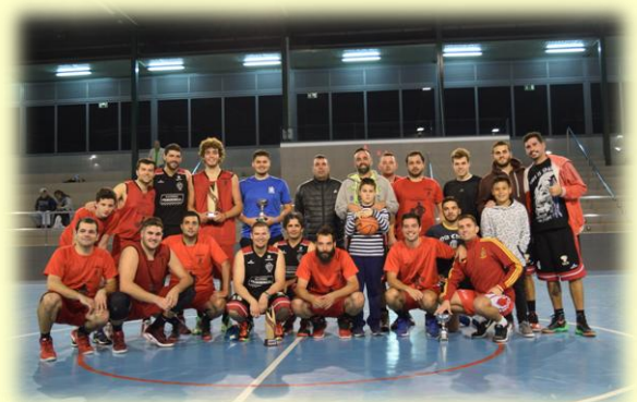
Foto en familia en la entrega de trofeos