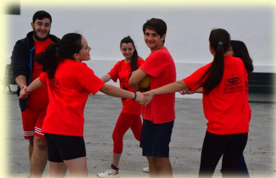
Juegos, leyendas y Charlas educativas sobre la Villa de San Andrés amenizaron las navidades educabaskeras