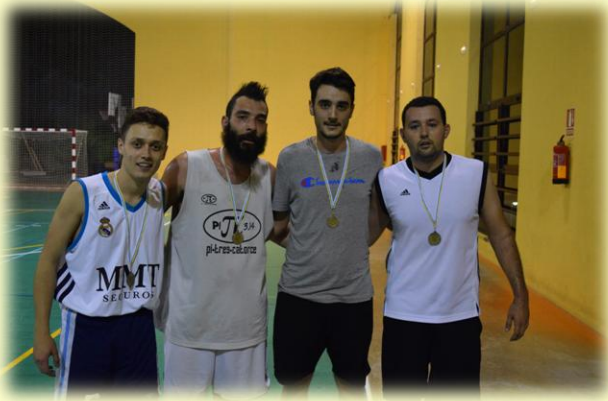
Sisigan's Players fue el campeón senior. Abajo, Repuestos Josiño, campeón junior.

En definitiva, una tarde-noche de siete horas, llena de baloncesto para recordar a quien hace más de media centuria, formara el primer CB Saucos de la Historia.