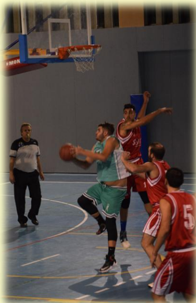
El encuentro fue muy disputado e igualado