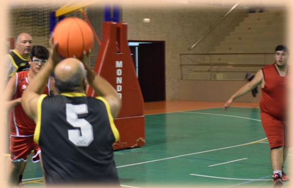
Los padres y entrenadores se esforzaron para lograr la victoria.