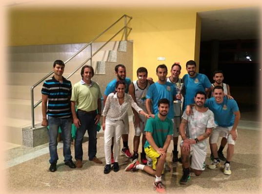
Breña Baja campeón por primera vez. Nadie lo esperaba.