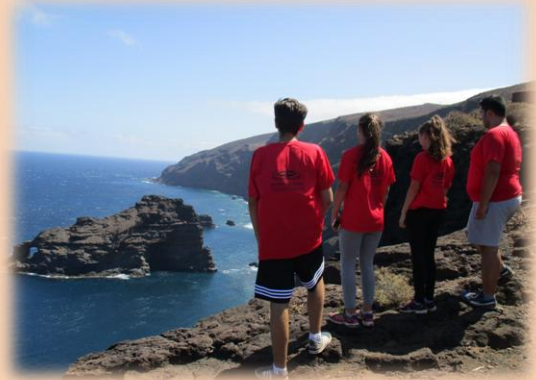
Los acantilados garafianos, sorprendieron a los chicos y chicas de Educabasket.

Educabasket es un programa educativo, deportivo y recreacional, cofinanciado por la Fundación CajaCanarias, que busca el disfrute de los más pequeños en San Andrés y Sauces en base al deporte, la educación ambiental, el conocimiento del medio y la educación en valores, entre otros aspectos. Se divide en tres grandes bloques: el deportivo, con sesiones de tecnificación deportiva de baloncesto. Un segundo bloque educativo, basado en el conocimiento del medio y la historia local e insular mediante talleres, excursiones, convivencias, etc. Un tercer bloque es el recreacional, en donde se intenta el disfrute del alumnado en actividades de diferente índole como campamentos, viajes y otras actividades en donde también se insertan contenidos para la sensibilización ambiental, la educación en valores, etc.