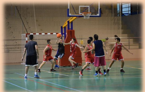
Tarde divertida en el Pabellón Saucero. Padres e hijos, disfrutando juntos del baloncesto.