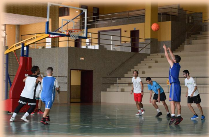
Medina no pudo llevar a la Plaza al campeonato