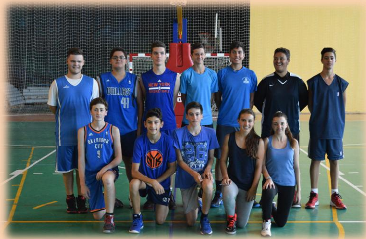
La Plaza Más Empinada, fue el subcampeón.