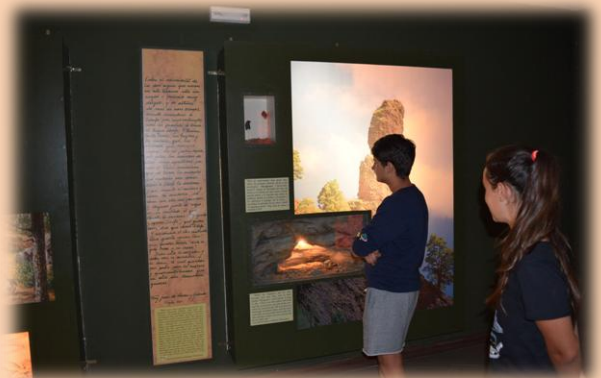
Espacios como la Zarza y la Zarcita fueron visitados en el BasketCampa.