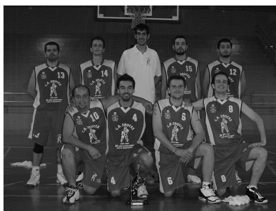
Formación del C.B.Sauces, temporada 2006/2007.

Así una vez celebrada, el equipo campeón fue el CB Breña Baja, tras imponerse por 100-95 al CB Roque Idafe, en un partido disputadísimo.