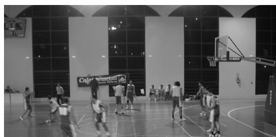
Partido C.B. Sauces - C.B. Breña Alta, 18 de Noviembre de 2006. Pabellón Municipal.