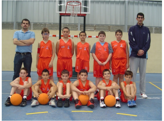
Equipo minibasket 2005. Su primer año.