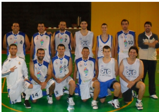
UB La Palma liga insular 2009 2010

El IV Torneo Insular de Navidad organizado como cada año por el CB Sauces fue para el UB La Palma que venció a sus dos contrincantes en la semana que duró el torneo.