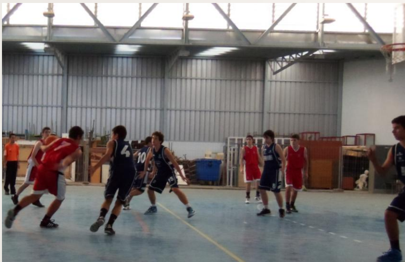
Un equipo inferior como el Dominicas nos pintó la cara y nos dio una lección.