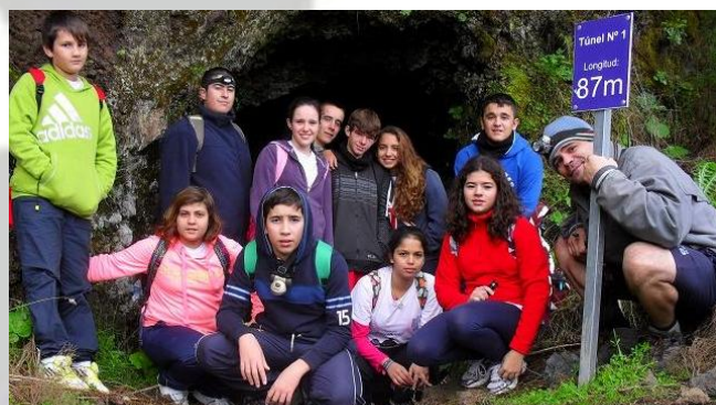
La Patrulla Educabasket visitó los Nacientes de Marcos y Cordero. Además se lo pasaron genial con los diferentes juegos y actividades realizadas.