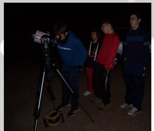
Muchos padres arrestaron a sus hijos por las notas en la segunda evaluación y no dejaron asistir a los chicos a esta actividad. Sin duda un error.