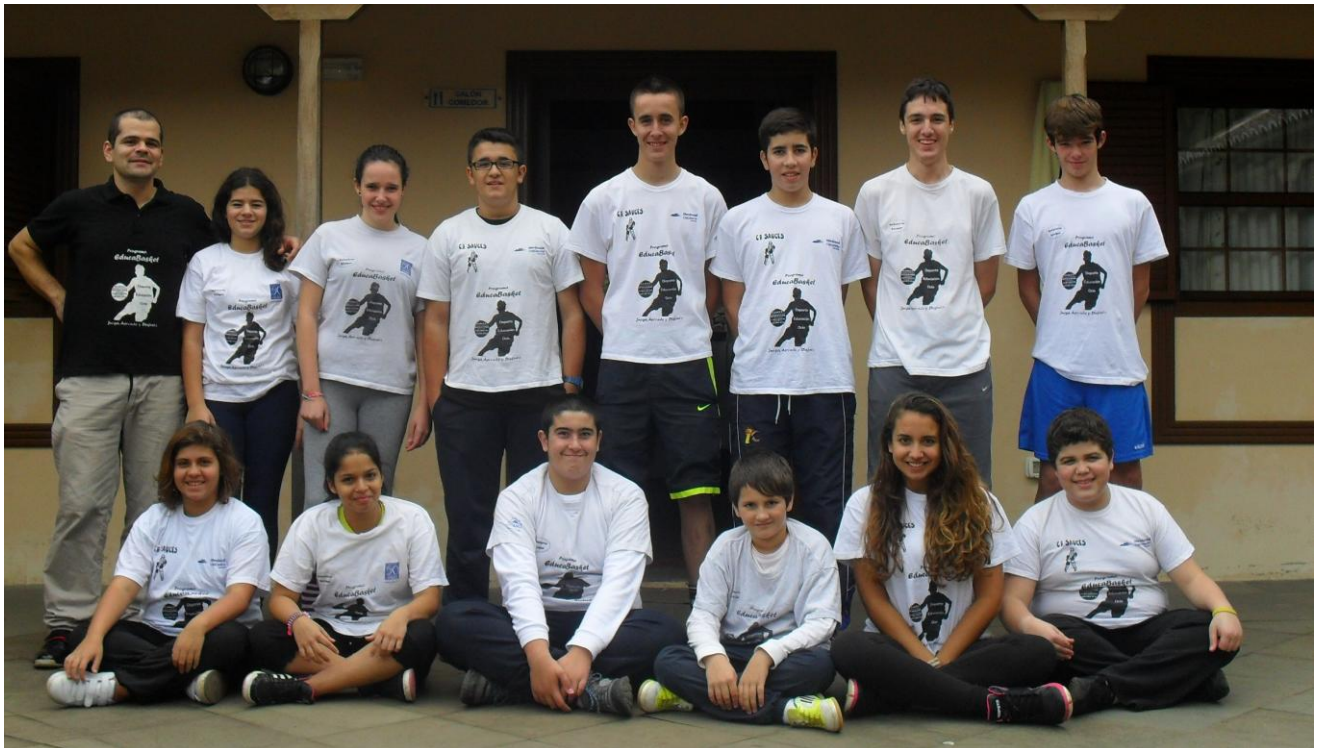
Destacamento del Educa que asistió a la Convivencia en Las Cancelas 2012.