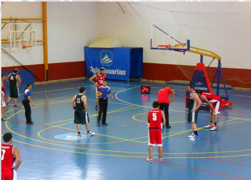
El debut ante Tacoronte demostró que el Saucés daría guerra.