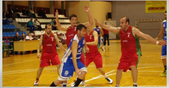
La defensa zonal 2-3 ahogó al Aridane.