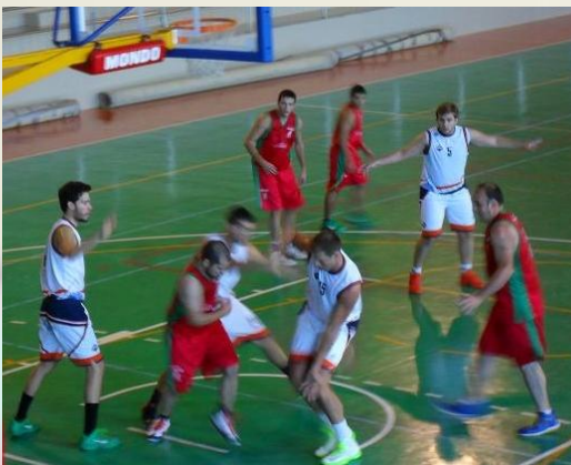
El Sauces no fue rival para el Tenerife.

El Tenerife Baloncesto pasó como un vendaval por el pabellón saucero y se llevó por delante a nuestro equipo. El alto ritmo impuesto por el conjunto que estuviera hace siete años en ACB -y el pasado en LEB Plata- hizo que ya en el primer cuarto la distancia fuera considerable. Hasta ocho jugadores que el pasado año jugaron en LEB Plata –no descendieron sino que bajaron dos categorías por el proceso de convergencia- llegaron a tierras sauceras con el Tenerife, que no encontró escollo en nuestro equipo (48-91). La velocidad en el juego y circulación del balón, su poderío interior así como las malas selecciones de tiro de los sauceros hicieron el resto. En ningún momento el rival bajó los brazos, demostrando por qué es el líder de la competición. Apretaron y presionaron a los sauceros hasta los últimos segundos. En los sauceros, el ataque fue nefasto. Malas selecciones de tiro acompañadas de pésimos porcentajes de tiro facilitaron el pase del rival, que no aflojó el ritmo hasta los últimos segundos.