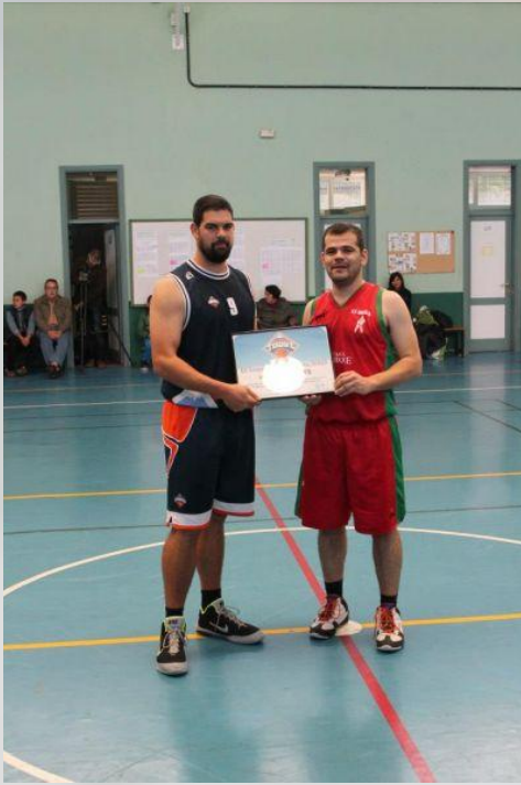
El Tenerife tuvo un detalle con el Club por su debut en Autonómica.