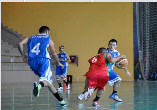
Los Sauceros, con muchas bajas plantaron cara.