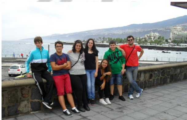
Los chicos y chicas: Educabasket: