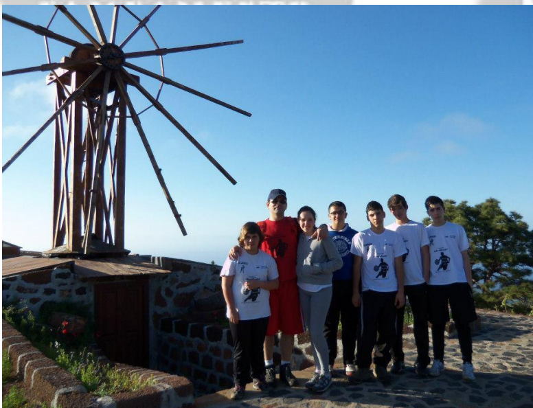
Educabasket se sensibiliza con el patrimonio local.

Entre la multitud de actividades, la observación de la luna y las estrellas fue de las que más gustó.