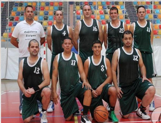
Formación del CB Sauces que consiguió su primera victoria en Autonómica. Lanzarote pasará a la historia del baloncesto saucero.